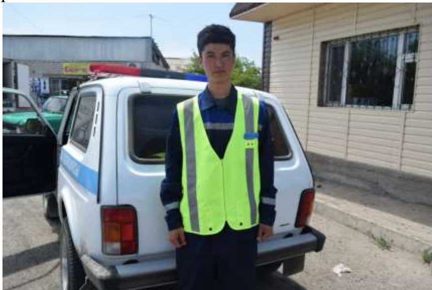
Жол полициясы органдарындағы технологиялық тәжірибе

зерттеу немесе дипломалдылық (тәжірибелік материалда ғылыми зерттеулер жүргізу) болуы мүмкін.