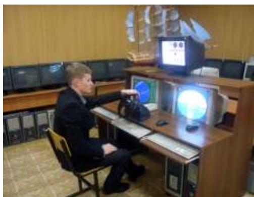
Кеме жүргізу тренажерындағы жұмыстар және технологиялық тәжірибелер

Колледж келесі кәсіпорындармен іскерлік және шығармашылық ынтымақтастық туралы ұзақ мерзімді келісім-шарттар жасайды: