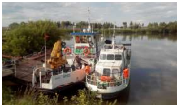
Кемелердегі технологиялық тәжірибе

Студентті кәсіпорынға алу үшін бұйрық беріледі, онда барлық қажетті мәліметтер толық жазылады (студенттердің аты-жөндері, тәжірибенің мерзімі мен мақсаты, өту тәртіптері, жауапты тәлімгер және т.б.).