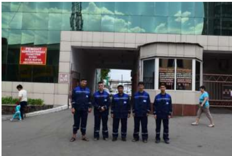
«Семей қ. таксомотор паркі» ЖШС

Колледж мамандықтары бойынша кәсіптік практиканы ұйымдастыру және өткізу Мемлекеттік жалпыға міндетті стандарттарға және ҚР техникалық және кәсіптік білім берудің Үлгілік оқу жоспарларына сәйкес жүзеге асырылады.