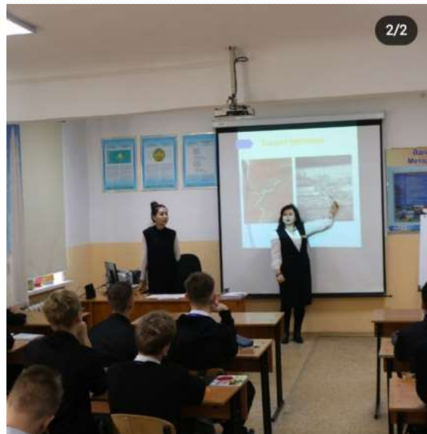
Интегрированный урок "Всемирная история и Валеология"