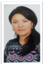
«Білім берудің жаңартылған мазмұнына менің көзқарасым»

Біз өзгеріс дәуірінде өмір сүріп жатырмыз. Өзгерістер біздің өміріміздің кез-келген саласында болады. Қазақстандық білім беру жүйесі мен оның мазмұны да жаңаруда. Сондықтан, уақыт талабына сәйкес, біз жас ұрпақты оның алдында тұрған мәселелерді шешу үшін жаңа ақпаратты игеру және пайдалану қабілетіне үйретуіміз керек. Жаңартылған бағдарламаның жаңалығы бағдарламаның әрбір мақсаты бойынша күтілетін нәтижелерді нақты айқындау болып табылады. Біз оқытушыға да, оқушыға да мақсатқа жету дәрежесін анықтауға көмектесетін оқу нәтижелерін дәл бағалай аламыз.